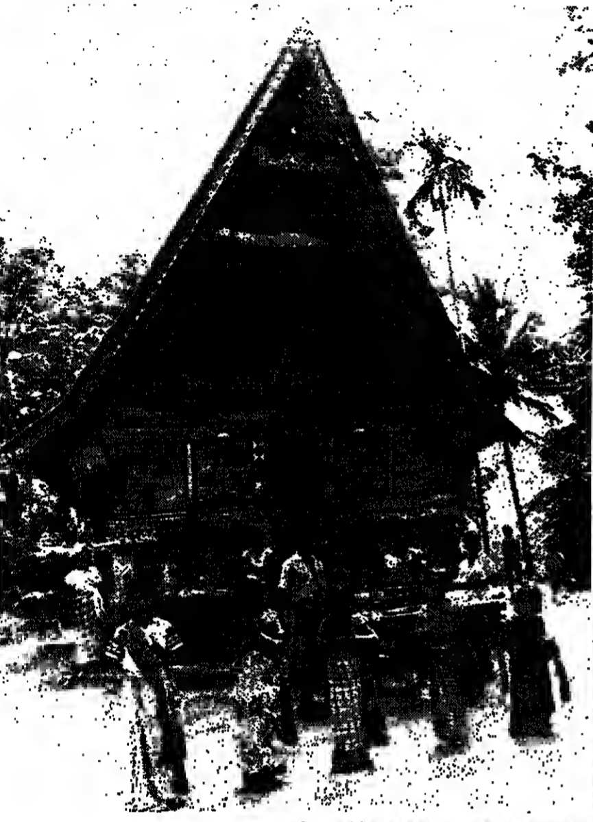
Die traditionellen Batok-Dörfer mit den kunstvollen Stelzenhäusern, die aus dem harten Pekkholz ohne einen einzigen Nagel errichtet werden.